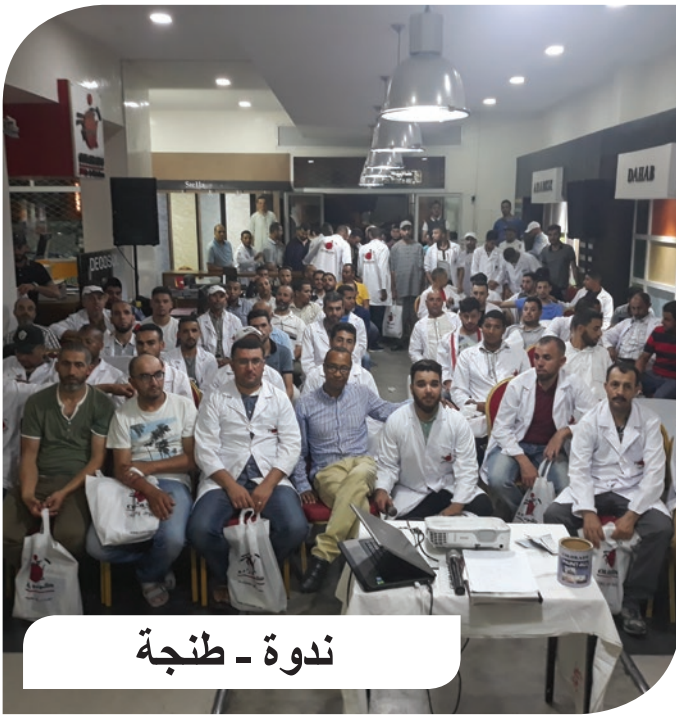
ندوة - طنجة

تتولى شركة كولورادو أهمية بالغة لتكوين الدهانين و المهنيين الراغبين في تحسين معارفهم التقنية، و لهذا الغرض، فقد تم إنشاء 11 مدرسة تكوين على مستوى أهم المدن المغربية . تنظم شركة كولورادو بانتظام حلقات دراسية لفائدة الدهانين من أجل تدريبهم على أحدث المنتجات وتقنيات التطبيق المقابلة. و يحصل الدهانون في نهاية التداريب، على شهادات تقديرية وبطاقات التدريب المهني. واستفاد سنة 2019 ما لا يقل عن 1700 دهان مهني من الدورات التدريبية و الندوات التي تُنظم داخل مدارس الشركة . فيما يلي صور بعض الندوات والدورات التدريبية التي نظمتها شركة كولورادو لفائدة المهنيين خلال سنة 2019.