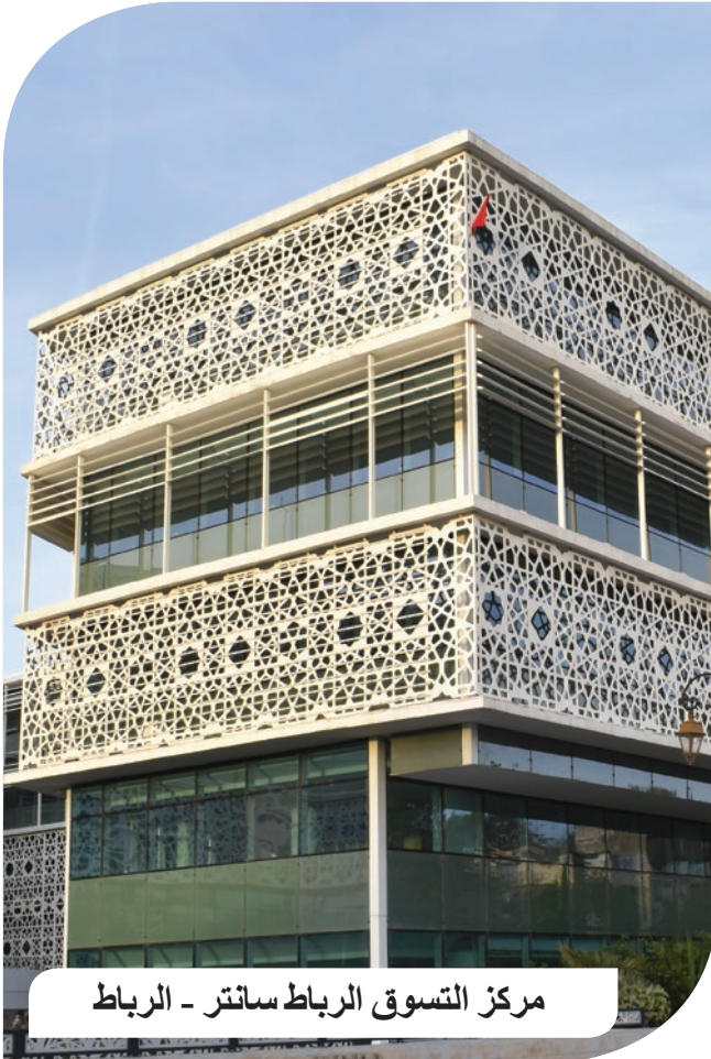
مركز التسوق الرباط سانتر - الرباط