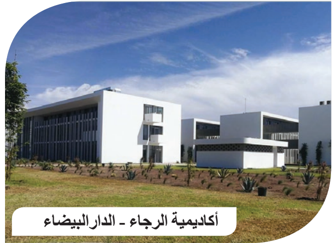
أكاديمية الرجاء - الدار البيضاء