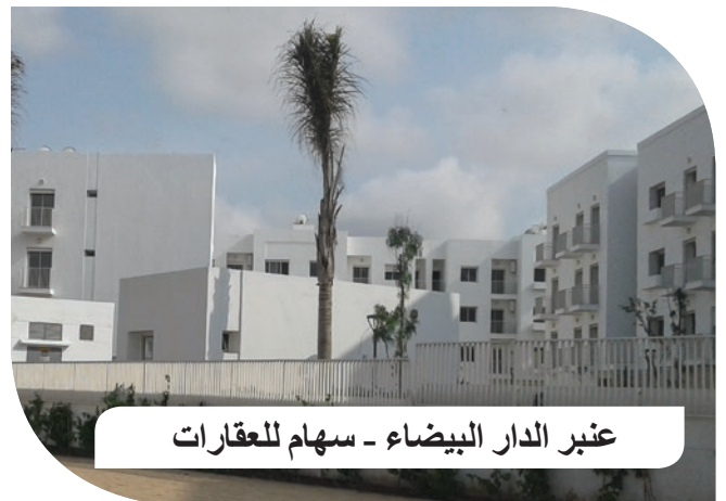
عبر الدار البيضاء - سهام للعقارات