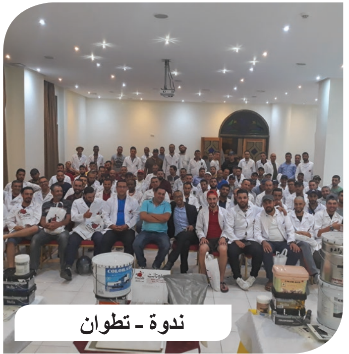
ندوة - تطوان