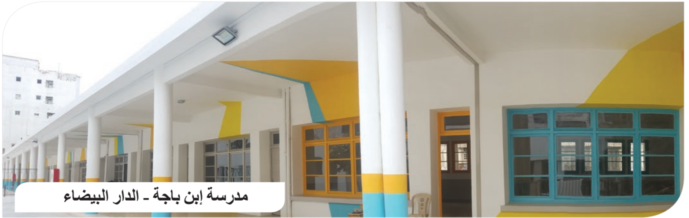
مدرسة ابن باجة - الدار البيضاء