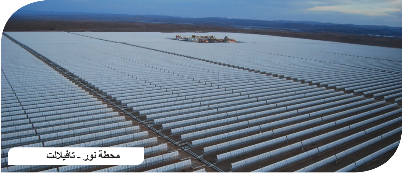
محطة نور - تافيلالت

تم إنجاز العديد من المشاريع الكبرى باستخدام أنظمة صباغة شركة كولورادو. الصور أسفله تعرض بعض هذه المشاريع التي تم إنجازها بمنتجات شركة كولورادو في جميع أنحاء المغرب.