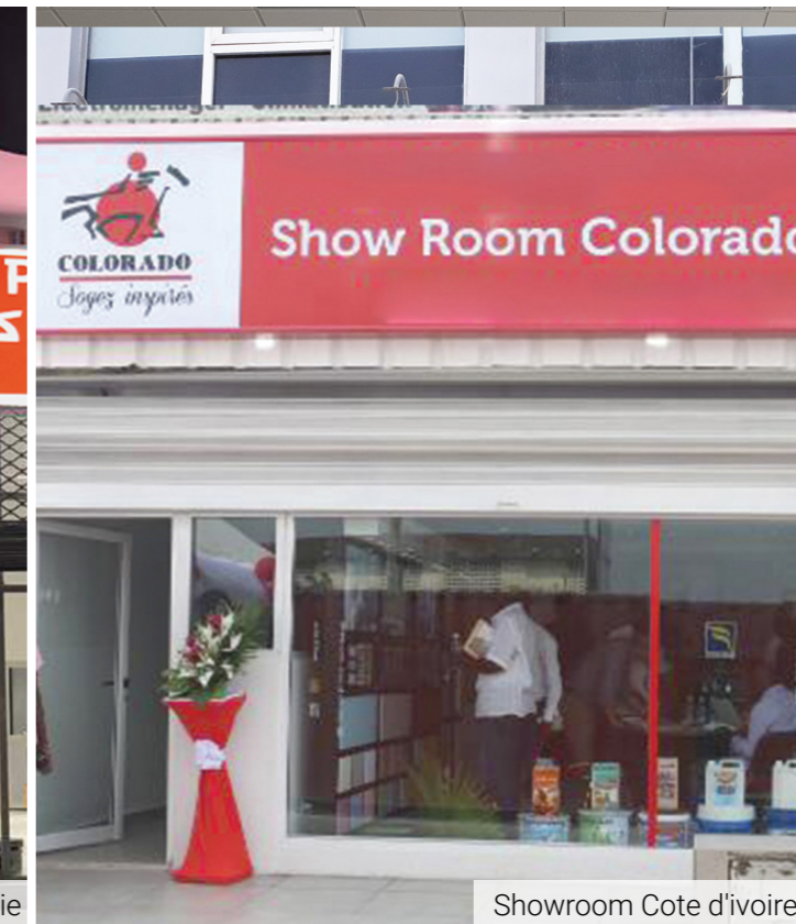
Showroom Cote d'Ivoire